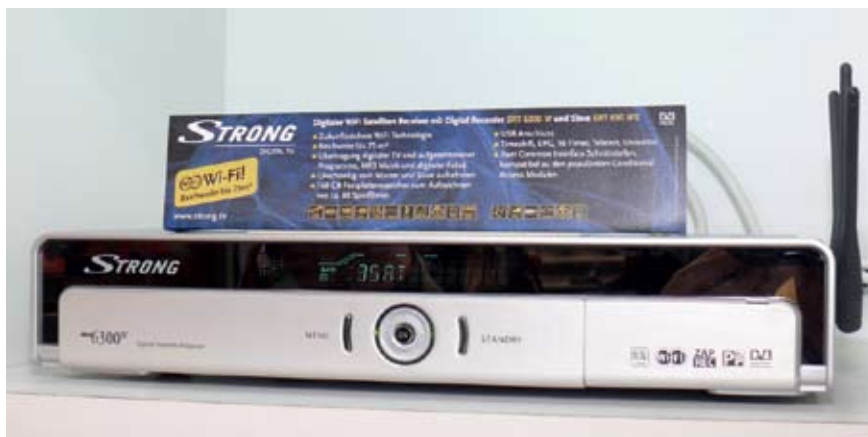
De nye modtagebokse, der forventes på det danske marked i løbet af efteråret, vil stort set alle opfylde de kommende EU-krav til strømforbruget. Boksen her er fra det tyske marked, på ANGA messen i Köln.