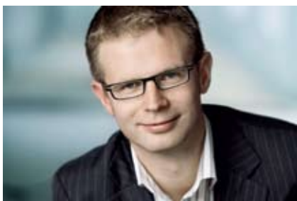
Folketingsmedlem Benny Engelbrecht, Socialdemokraterne.

”Vi vil gerne leve op til ordningen med såvel