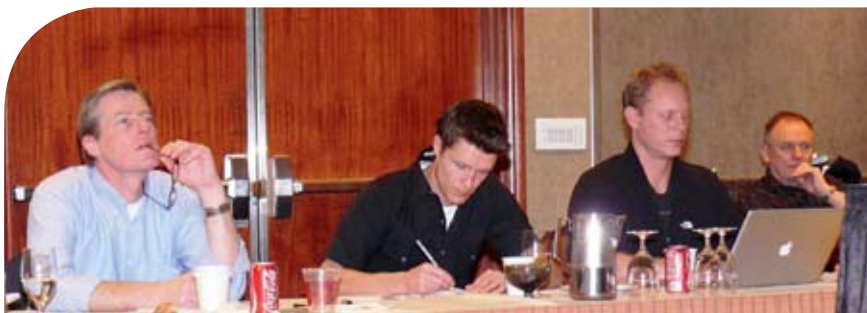
Årets pressemøde på CES havde stor bevågenhed fra såvel pressen som de øvrige danskere, der var til stede i Las Vegas.

I alle tilfælde er der tale om udviklingen i styk, som totalt for alle produkter er steget i solgte stykker i 2008 og fortsat stiger i 2009. BFE fremlægger de endelige tal for 2008 i Bulletin og Magasinet DIGITALT i udgaven den 9. marts.