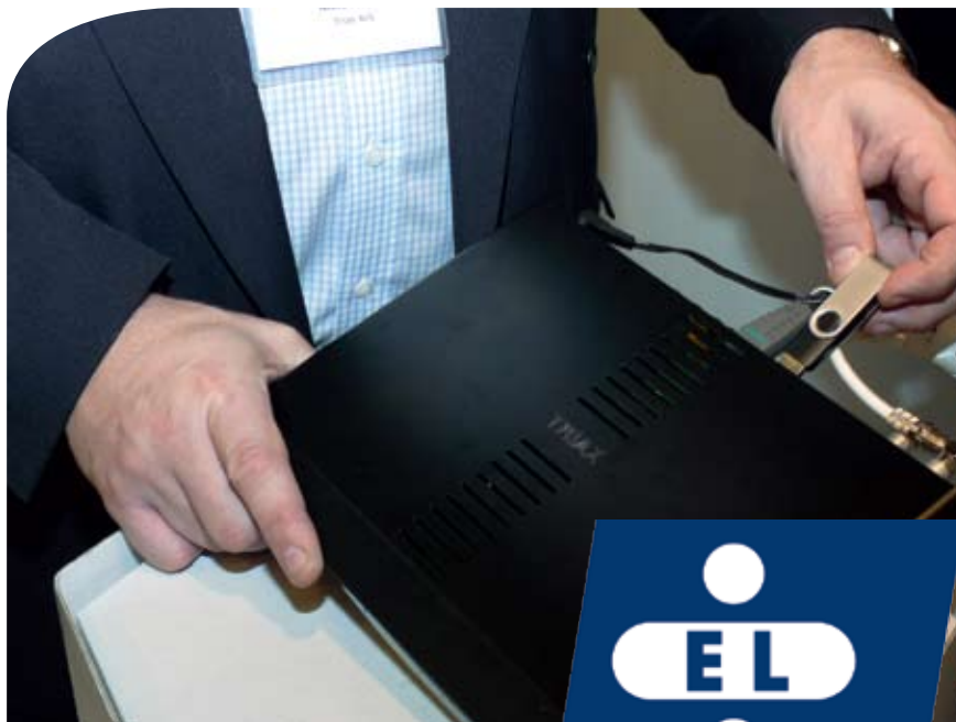
En af Triax' energivenlige bokse, som blev præsenteret på FDA messen i Vejle i efteråret, kan sammen med andre energivenlige modtagerbokse bruge Elsparefondens mærke.

”Vi har efterhånden fået en del af sådanne