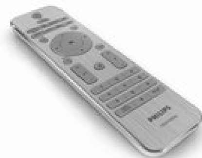
Stand-by forbrug Flat TV